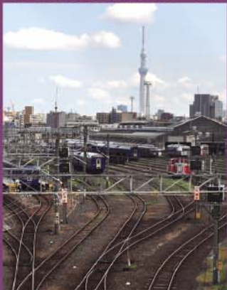
上中里さわやか橋から尾久車両センターを望む

新幹線や電気機関車の車両基地、引退した都電や蒸気機関車を見て歩く、鉄道のまち・北区ならではの散策コースです。飛鳥山にある小さなモノレール「アスカルゴ」に乗車するのもポイント。