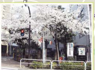
27 近藤勇と新選組隊士供養塔 滝野川7-8-10