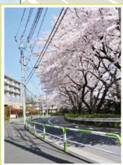
6 桐ヶ丘1丁目付近 桐ヶ丘1丁目