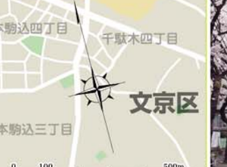
26 田端1丁目付近 田端1-22