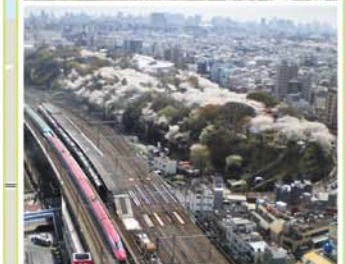
22 飛鳥山公園 王子1-1-3