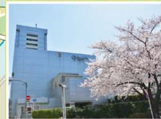
17 北とぴあ 王子1-11-1