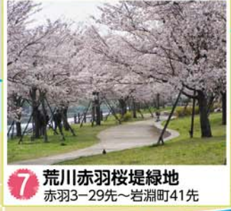
7 荒川赤羽桜堤緑地 赤羽3-29先~岩淵町41先