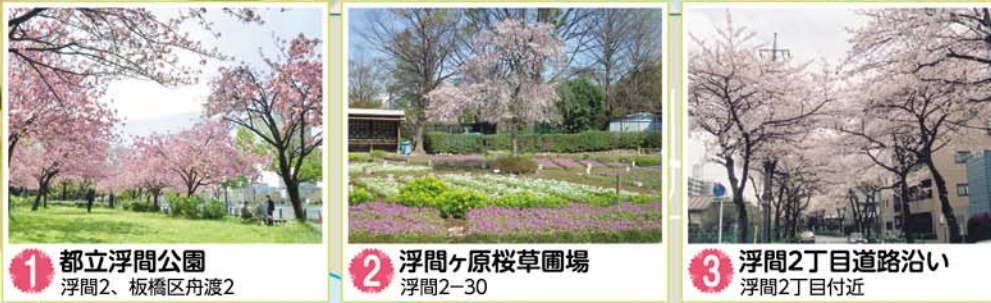
1 都立浮間公園 浮間2、板橋区舟渡2 2 浮間ヶ原桜草園場 浮間2-30 3 浮間2丁目道路沿い 浮間2丁目付近