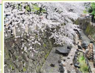
18 音無親水公園 王子本町1-1-1先