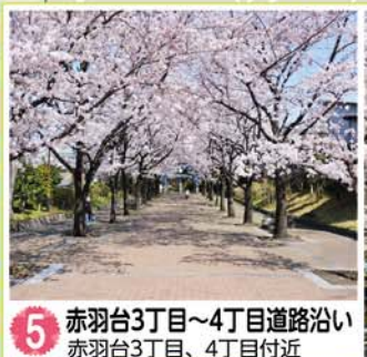
5 赤羽台3丁目~4丁目道路沿い 赤羽台3丁目、4丁目付近