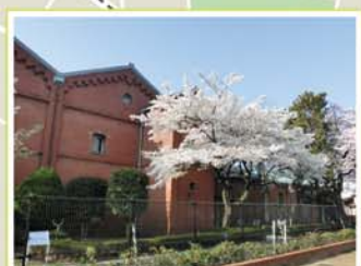
19 醸造試験所跡地公園 滝野川2-6-30