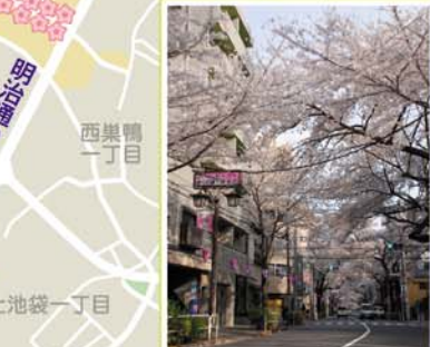
28 滝野川桜通り 滝野川7丁目付近