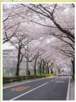
4 浮間中央通り 浮間5丁目付近