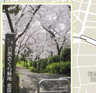
20 石神井川沿い 滝野川12丁目~5丁目