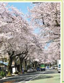
13 稻付西山公園 西が丘3-10-3