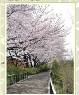
12 赤羽自然観察公園 赤羽西5-2-34