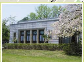
23 青淵文庫 西ヶ原2-16-1