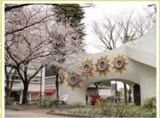
10 赤羽公園 赤羽南1-14-17