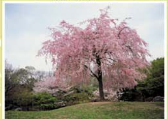
14 清水坂公園 十条中原4-2-1