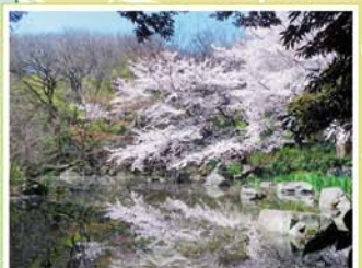
16 名主の滝公園 岸町1-15-25