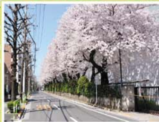
15 王子5丁目引込み線付近 東十条1丁目~3丁目、王子5丁目