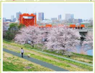
9 旧岩淵水門(赤水門) 志茂5-41地先