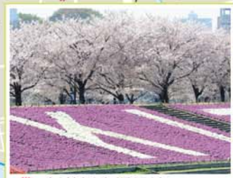
8 新荒川大橋緑地 赤羽3-29先