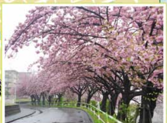
11 赤羽台団地外周 赤羽台1-4先、赤羽台2-1先