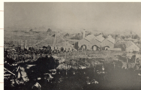
抄紙会社開業式

フランスから帰国後、栄一は日本を近代化するため、知識や情報を共有する新聞などの印刷物の普及が重要だと考え、抄紙 しよし 会社の設立を主導し、①物流に最適な石神井川の水運、②製紙工程に必要な千川用水の良質な水、③原料のボロ布の集積地・紙