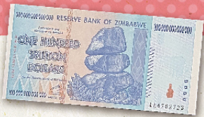
「経済混乱時のジンバブエ100兆ドル」 お札と切手の博物館 所蔵

ここは世界のお札が150種類以上並ぶ博物館。 一、十、百、千、万……ひゃ、100兆!? これ本物? 詳しくは博物館で調べてみよう!