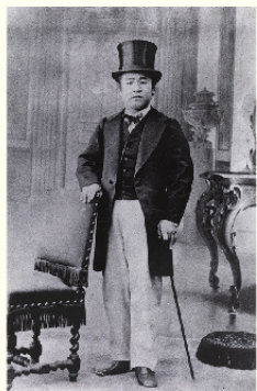
フランス時代の栄一

1840(天保11)年、現在の埼玉県深谷市の農家に生まれた栄一は、24歳で一橋慶喜(15代将軍徳川慶喜)に仕官。27歳でフランスへ渡航、欧州の先進技術、社会経済制度などを学びました。帰国後、29歳で明治政府民部省へ出仕し、貨幣制度、銀行制度の立案などに関わりました。