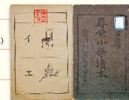
国定時代の教科書 国定1期(明治37-42年)