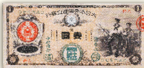
国産第一号の近代的な紙幣

した抄紙会社工場の一角を使って紙幣用紙の研究開発を重ねました。翌年、国産第一号の近代的な紙幣を誕生させました。