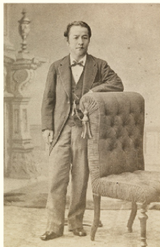
43歳の栄一[1883(明治16)年] 洪沢史料館 所蔵

33歳で官僚を辞め、実業界に踏み出すと、目覚ましい活躍を続け、1931(昭和6)年、その生涯を閉じました(91歳)。