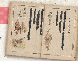
墨塗り教科書『ヨミカタニ』 出典:同上

ここにはいろんな時代の教科書が展示されてるよ。 おや? 文章が黒く塗りつぶされているのは何故? 東書文庫に行って館長に聞いてみよう!