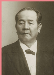
洪沢栄一 (1840~1931)

1 万円札に描かれた人物は、これまで〈聖徳太子〉と〈福沢諭吉〉の二人だけでしたが、2024(令和6)年度上期からの新一万円札の肖像は「日本資本主義の父」とも称される〈洪沢栄一〉になります。