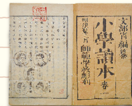
国定以前の教科書 1873(明治6)年

1909(明治42)年、国定教科書を翻刻発行する会社として、東京書籍株式会社 ほんこく堂 が設立されました。