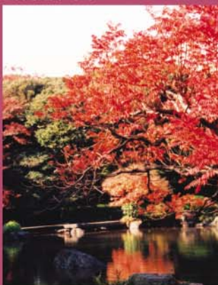
旧古河庭園の紅葉

日本庭園の六義園、洋風庭園と日本庭園が調和した旧古河庭園、という美しい庭園めぐりが楽しめます。また、二葉亭四迷をはじめとする著名人たちが眠る霊園、お寺にも立ち寄ります。